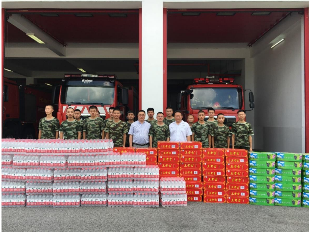
公司近年公益行为汇总简表